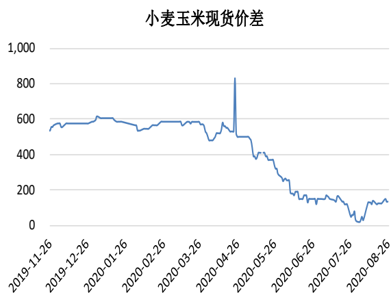
图 3：山东地区小麦玉米现货价差（元/吨）