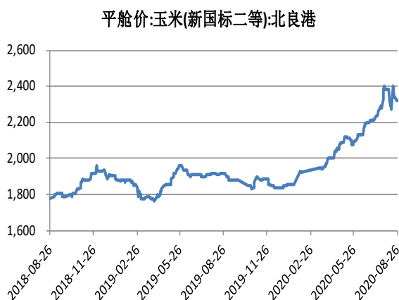
图 1: 北方港口玉米价格 (元/吨)